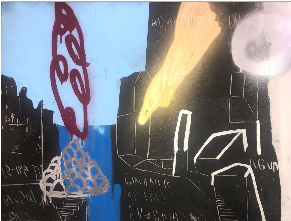
Figura 1: Pandemia. Trabajo de Marcelo Solá para Halac - Goiânia, Goiás, Brasil, junio de 2020

Para todos nosotros, de SOLCHA y HALAC, este gran laboratorio nos ayuda a reflexionar y esperar días mejores. Después de la crisis estarán, sobre la mesa, los resultados de este gran laboratorio pero nada haremos con ellos sin la acción social transformadora, sin la gente, sin la mujer y el hombre de al lado, sin los padres, sin nuestras abuelas y abuelos, tan vulnerables ante el virus. Nada haremos sin su historia. Si acaso no comprendemos nuestra propia vulnerabilidad, bastará con voltearse y contemplarse a sí mismo en este preciso instante: usted, yo, aisladas y aislados en casa, en el escritorio, pensando en los artículos pendientes y en los libros que aún no hemos leído, mientras la epidemia corre afuera y no sabemos siquiera lo que va a pasar.